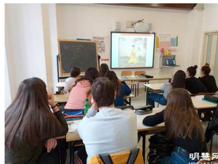
▲上图：课堂上学生们认真观看师父教功视频。↓下图：高中生们正在学炼第五套功法-打坐。

今年的5月13日是世界法轮大法日，高中的学生们也真诚地双手合十，感激法轮大法师父将大法传给世界，使他们能听闻并受益于大法的美好！他们真诚地恭祝师父生日快乐！并祝贺世界法轮大法日！◇