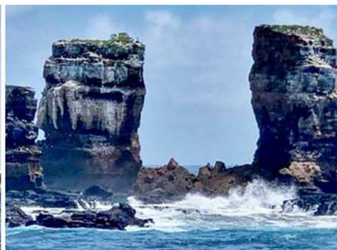
▲二零二一年五月十七日，厄瓜多尔环境部公布：“达尔文拱门”崩塌。左图是坍塌前的拱门。右图显示，该拱门仅剩下两根柱子。