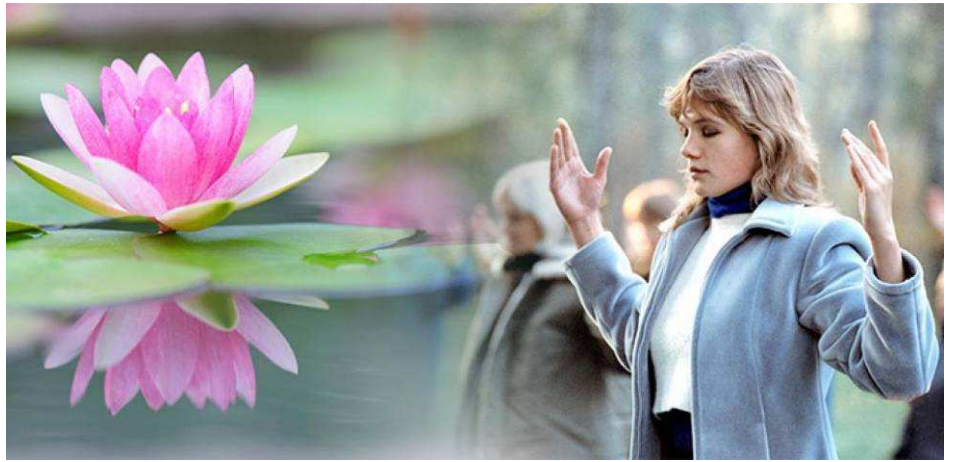
法轮功第二套功法演示

他说：“我们当初那么为共产党卖力，现在却成了共产党要清除的‘害群之马’。你说讽刺不讽刺？”◇